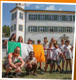
JUGENDHAUS SCHLOSS PFÜNZ